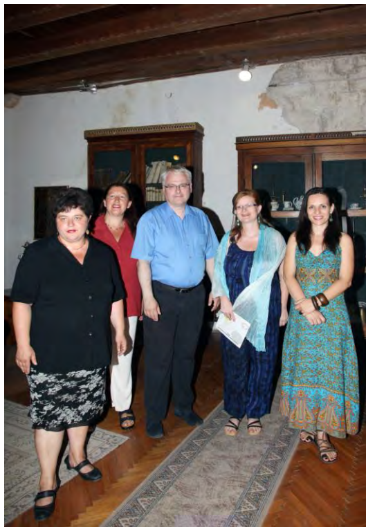
Predsjednik Ivo Josipović i djelatnice Gradskog muzeja