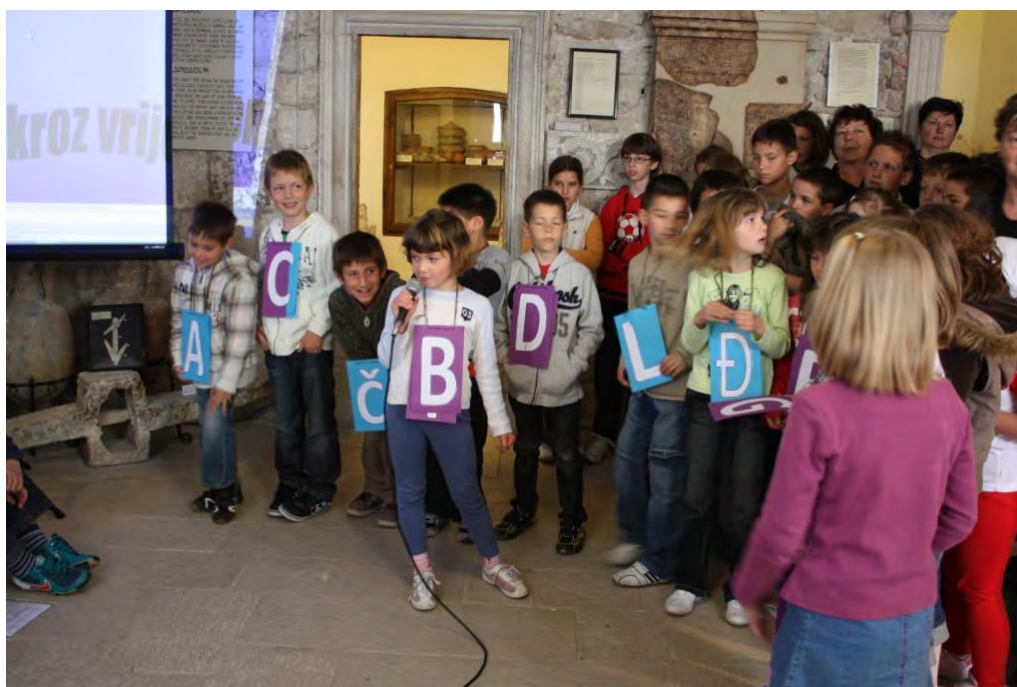
Obilježavanje Međunarodnog dana muzeja 18. svibnja